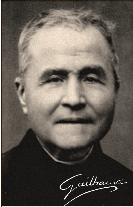
Venerable Antoine Pierre Jean Gailhac

Béziers 13 - Noviembre - 1802 25 - Enero - 1890